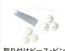
取り付けピース・ピン ※ピンは3本予備付き