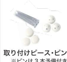
取り付けピース・ピン ※ピンは3本予備付き